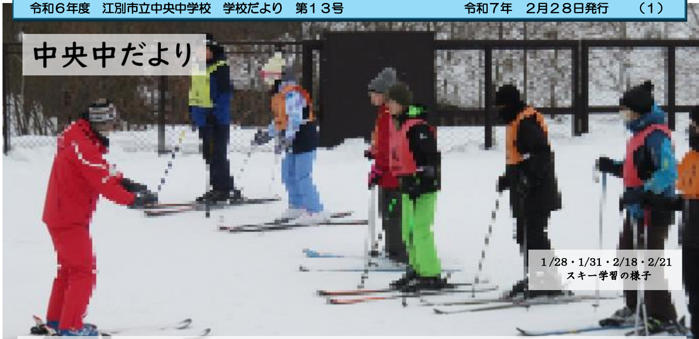
1/28・1/31・2/18・2/21 スキー学習の様子

令和6年度重点「気づき、考え、工夫する、主体的に自他の成長のために行動する生徒」の育成